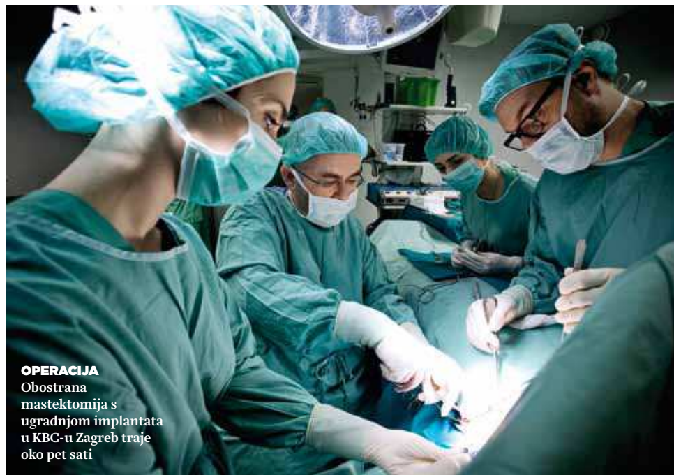
OPERACIJA Obostrana mastektomija s ugradnjom implantata u KBC-u Zagreb traje oko pet sati